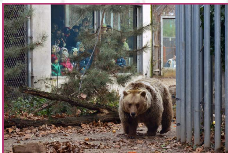
Állatkertünk hagyományos rendezvényén a mackóárnyékot lessük.