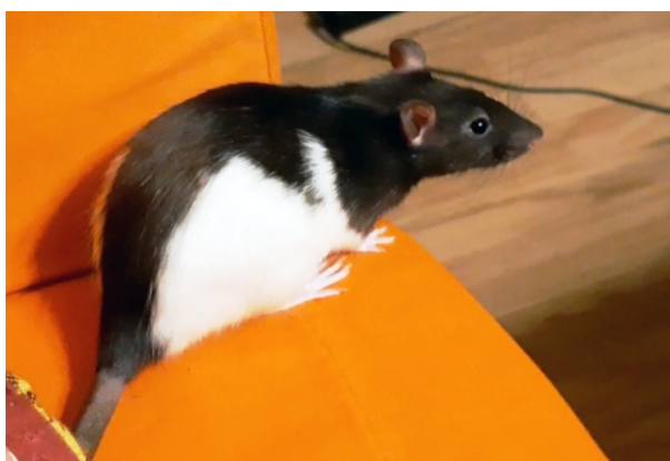
Bodza megtanulta, hogy veszélyes leugrani ismeretlen magasságokból

Bodza hármunk közül a legvakmerőbb, ő a saját bőrén tanulta meg, hogy mennyire veszélyes fejest ugrani a mélységbe egy lendületes fogócska közben. Ma már jóval óvatosabb, és mindig megáll a kanapé szélén, mert sosem tudni, mekkora mélység vár odalenn.