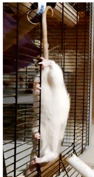
Ha használhatok létrát, a magasság nem számít.

Meséltem édesanyánkról, aki az állatbemutató patkánytársulat tagja, és mi is kiváló akrobatikus képességeket örököltünk tőle. Ennek mindig nagy hasznát vesszük, amikor ismeretlen magasságokban kell közlekednünk.