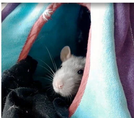
Benéz a nap az ablakon, és ti még ébren vagytok?