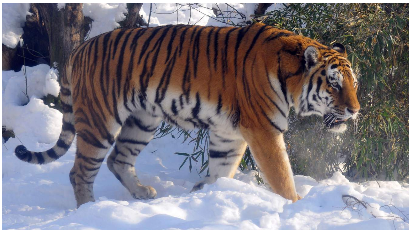
A tigrisek magányosan élnek, és védik a területüket, de egy hím birtoka több nőstény territóriumával is átfedésben lehet.