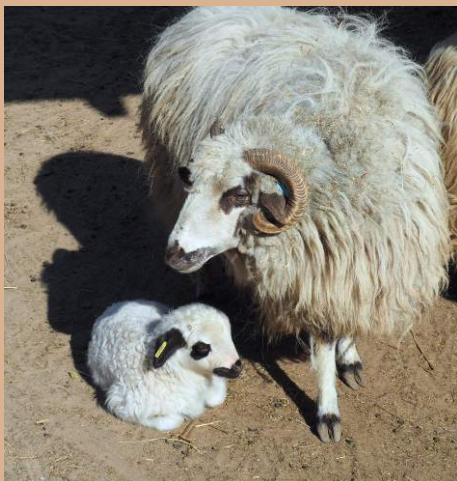
A nyájban minden egyes anyajuh felismeri a saját bórnyát, és fordítva.

A patások az ellés után hosszasan nyalogatják újszülött utódjukat, aminek nemcsak az a célja, hogy megtisztogassák a szőrzetét és felpezsdítsék a vérkeringését, hanem az is, hogy memorizálják az egyéni illatát. A csordában vagy nyájban minden anyaállat megismeri a saját borját vagy gidáját, akár több száz egyforma kisállat közül is.