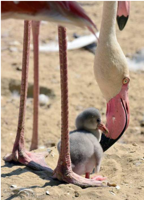
A flamingófióka és szülei közt a kikelés pillanatától kezdve erős kapcsolat alakul ki.

Bár a szociális érintkezés fajra jellemző alapjait az öröklődés határozza meg, az állatok társas érintkezése szorosan összefügg a tanulással. Az egyes egyedeknek mindenekelőtt fel kell ismeriük egymást. Konrad Lorenz nevéhez fűződik az imprinting, azaz bevésődés felfedezése, a tojásból kikelő madárfióka példáján keresztül, amely az elsőként megpillantott élőlényt (vagy akár tárgyat) tekinti anyjának, és ez akár az egész életére kihathat, téves párválasztási preferenciát eredményezve. Ugyanakkor a folyamat kölcsönös: ha a kotlós csibéit közvetlenül kikelésük után idegen fiókákra cserélik, gond nélkül elfogadja és nevelni azokat, 3-5 nap alatt azonban személyesen megismeri a csibéit, és ettől kezdve az idegeneket elzavarja. Még a darazsokról is kiderült, hogy felismerik egymást