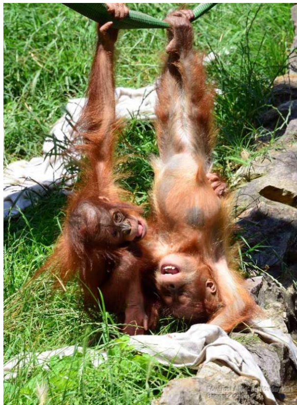
Az orángután magányosan él; a kölyköknek mindent, ami az élethez szükséges, az anyjuktól kell megtanulniuk.

A társas életmód lehetőséget ad az utánzásra, amely hatékony formája a tanulásnak. A főemlősök kicsinyei szinte mindent az anyjuktól lesnek el, sokszor még az ivadékgondozás fortélyait is. Az állat élete során megtanult dolgok, így például az eszközhasználat is anyáról utódjára száll, ami már a hagyományteremtés, a kultúra kezdetleges formájának is tekinthető. Ismert példa a japán makákók Kisima szigetén élő csoportja, melynek egy fiatal nőstény tagja 1953-ban rájött arra, hogy vízzel le tudja mosni a homokot az édesburgonyáról, illetve a vízben szét tudja választani a gabonamagvakat a homoktól. Nem kellett hozzá egy évtized, és a csoport tagjainak háromnegyede alkalmazta az eljárást. Figyelemre méltó azonban, hogy az idősebb példányok nem tanulták el ezt a viselkedést a náluk fiatalabbaktól. Nemcsak emlősök, hanem madarak körében is elterjedt az utánzás: Angliában például néhány széncinege megtanulta felnyitni az ajtók elé kitett tejesüvegek tetejét, hogy hozzáférjen az alatta felgyűlt tejszínhez, és a környék madarai ellesték egymástól a módszert.