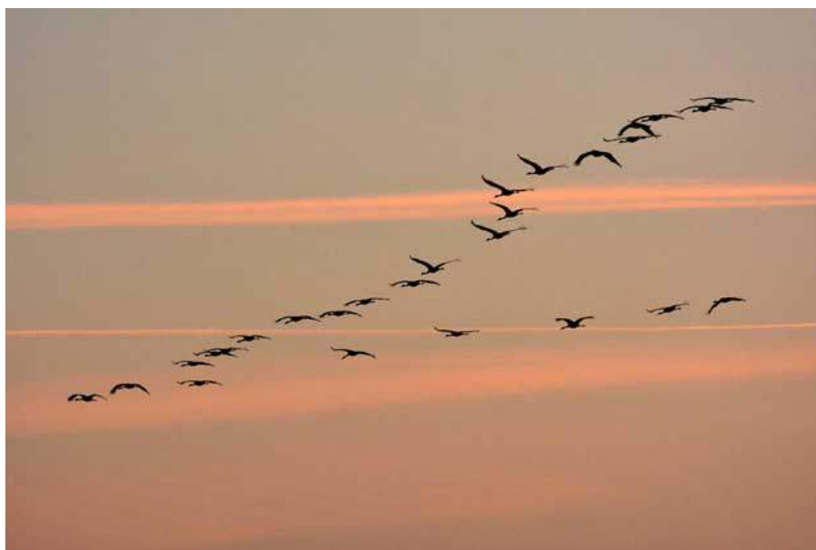
A vonuló madarak, mint például a vadludak vagy a darvak csapatának élén nem egy meghatározott vezető repül, személye felcserélhető.

Ahhoz, hogy társas lénynek lehessen nevezni egy állatot, az kell, hogy meglegyen benne a vonzódás a fajtársai iránt: a csapattól lemaradt galamb meggyorsítja röptét, hogy utolérje a többieket. Az igazán nagy madár- vagy halrajokra jellemző a személytelenség. Ezeknek a csapatoknak nincs vezetőjük: bármelyik egyed kezdeményezhet (például egy irányváltotást), és a többi követi. Tömegben úszni vagy repülni biztonságosabb, mint egyedül, már csak a ragadozók elleni védekezés szempontjából is. Jó példa erre a seregélycsapat, amelynek tagjai normális esetben egymástól meghatározott távolságot tartva repülnek, ám ha megjelenik a ragadozó, a madarak közelítenek egymáshoz, és a raj ún. támadó ékbe tömörül. A nagy csapatok általában azonos fajú állatokból állnak, de előfordulnak vegyes csoportok is: sokszor különböző madarak vonulnak vagy telelnek közös csapatban, az afrikai szavannán pedig sokféle patás legel vegyes csordákban, melyekhez olykor még struccok is társulnak.