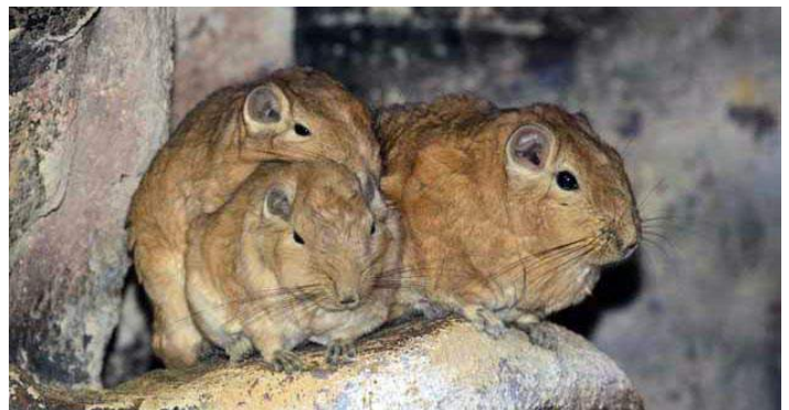
A gundik összebújva védekeznek a hideg ellen.