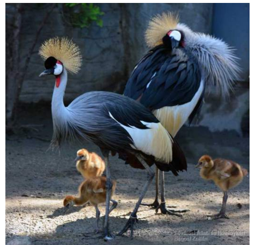
A koronás darvknál mindkét szülő kiveszi a részét a fiókák neveléséből.