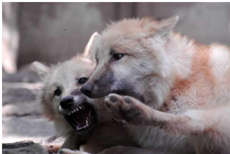
A farkaskölykök a harcias játékok során tanulják meg a lovagias küzdelem szabályait.

Az egy csoportot alkotó állatok közt gyakoriak a rangsorviták, ugyanakkor a csoport fennmaradási sikere szempontjából sem lenne előnyös, ha ezek súlyos sérülésekkel járnának: a farkasfalka zsákmányszerzési esélyeit például rontja a falka bármelyik tagjának sebesülése. Ezért a rangsorviták, bár sokszor látványosak, többnyire ritualizált párbajok, és az alul maradó félnek megvan a lehetősége feladni a harcot, elismerve a másik győzelmét. Erre kialakultak a megfelelő mozdulatok: a farkasok (és kutyák) például hanyatt fekvő vagy a földre lapulva a nyakukat tartják oda az ellenfélnek. A patások szarvai is elsősorban párbajfegyverek, és nem gyilkos szerszámok: az ökklődöző bikák célja, hogy egymást eltolják, hátrálásra kényszerítsék, de súlyos sérüléseket ritkán okoznak közben. Ez jól látszik már abból is, hogy szarvakat csak növényevő állatok viselnek: aki ölni akar, nem szarvat növeszt, hanem fogakat és karmokat.