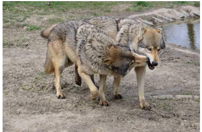
Egymás szájszélének nyalogatása a farkasoknál alázatos gesztus, amely a kölyökkori élelmekérésből alakul ki.