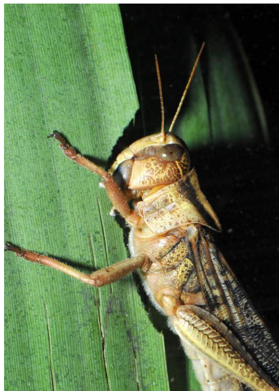
A vándorsáskák csak túlnépesedés esetén tömörülnek rajba, egyébként távolságot tartanak egymástól.

Nem minden állat vonzódik a fajtársaihoz. Vannak megrögzött magányosok, amelyek kerülnek a többiek társaságát, sőt, akár kimondottan ellenségesen viselkednek egymással szemben: magánterületet foglalnak, amelyre idegen fajtársat nem engednek be. Ha úgy vesszük, ez is a társas viselkedés kategóriájába tartozik, hiszen kommunikációval jár. A hím tigris szagjeleivel és üvöltésével jelöli ki territóriumát, amely több nőstényével is átfedésben lehet, de idegen kandúrt nem tűr meg rajta. A kaméleon harci színekkel nyilvánítja ki ellenérzését társaival szemben, és kivételt csak az ellenkező nemmel tesz, de azzal is csak a párzási időszakban. Egyazon faj egyedei sem viselkednek mindig egyformán. A vándorsáskák például alaphelyzetben (a párzáson kívül) nem keresik egymás társaságát, ám ha egy bizonyos állománysűrűséget túlléptek, megjelenik a vándorló nemzedék, amelynek már a lárvái is kimondottan vonzódnak egymáshoz.