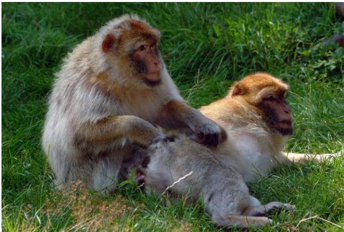
A berber makákók és egyéb majmok kölcsönös testápolásának szociális kapcsolattartó szerepe van.

Az állatok társas kapcsolatainak kialakítása szertartásos viselkedésformák egész sorát kívánja meg, amelyek igen eltérőek az egyes állatfajoknál. Ilyen például a főemlősöknél, de egyes rágcsálóknál is a testápoló viselkedés, amelyet az etológusok kurkászásnak neveznek. Célja látszólag egymás szőrzetének tisztítása, karbantartása, ám valójában ennél jóval többről van szó. A kurkászás gyakorisága és kölcsönösségének foka a benne részt vevő példányok rangsorban elfoglalt helyére utal: az alárendelt majom jóval többet kurkássza a magasabb rangút, mint fordítva. Azoknál a főemlősöknél, amelyeknél a csoport összetétele bonyolult és a rangsor könnyen átalakulhat, a kurkászásnak jóval nagyobb jelentősége van, mint azoknál, ahol a rangsor stabil, állandó, mint például a gorilláknál, amelyeket igen ritkán láthatunk egymás szőrzetében matatni.