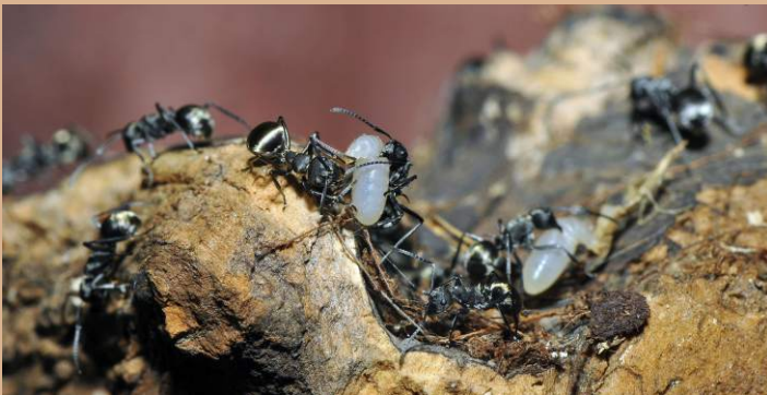
A dolgozó hangyák szaporodásképtelenek: a lárvák, amelyeket gondoznak, a királynő utódai.

A legfejlettebb társas szerveződést az állatvilágban az államalkotó rovaroknál figyelhetjük meg. A kolóniában élő egyedek kasztokra oszlanak, és mindegyiknek megvan a maga feladata. A hangyaboly vagy a méhcsalád dolgozói egymás nélkül életképtelenek, hiszen szaporodni sem tudnak. Új kolóniát alapítani egyedül az anya (királynő) tud.