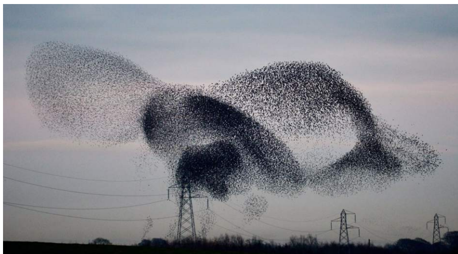
A seregélyraj összehangoltan mozog, noha nincs vezetője. Támadás esetén a raj összesűrűsödik.