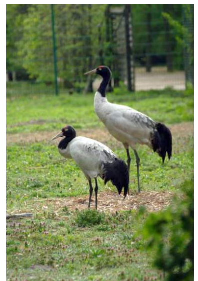
A feketenyakú darvak évről évre szertartásos tánccal erősítik meg párkapcsolatukat.