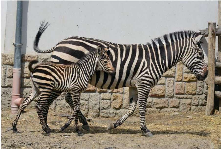
A szavannán a zebrák más patásokkal is társulnak, de a saját csikóját mindegyik maga gondozza.