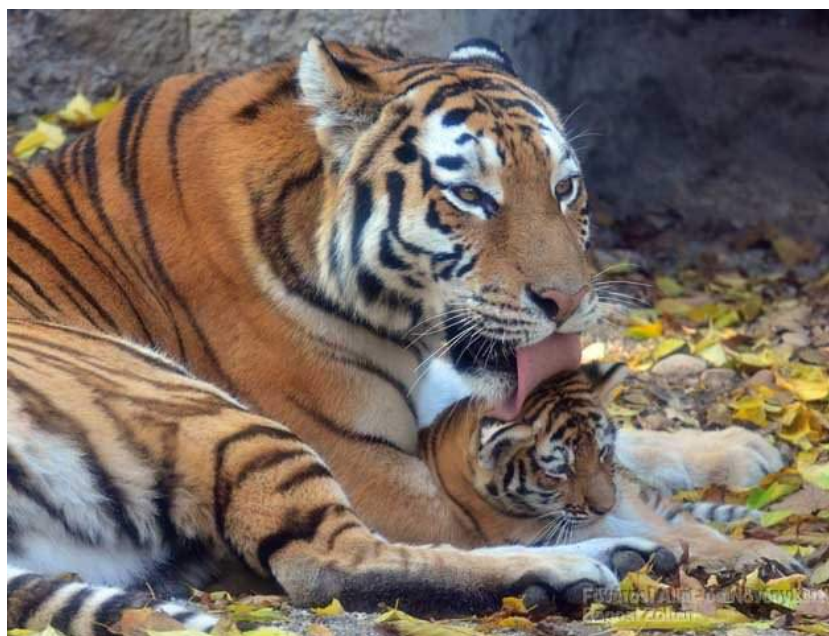
A tigriskölyköknek nagyon sokat kell tanulnia az anyjától, például zsákmányt szerezni.