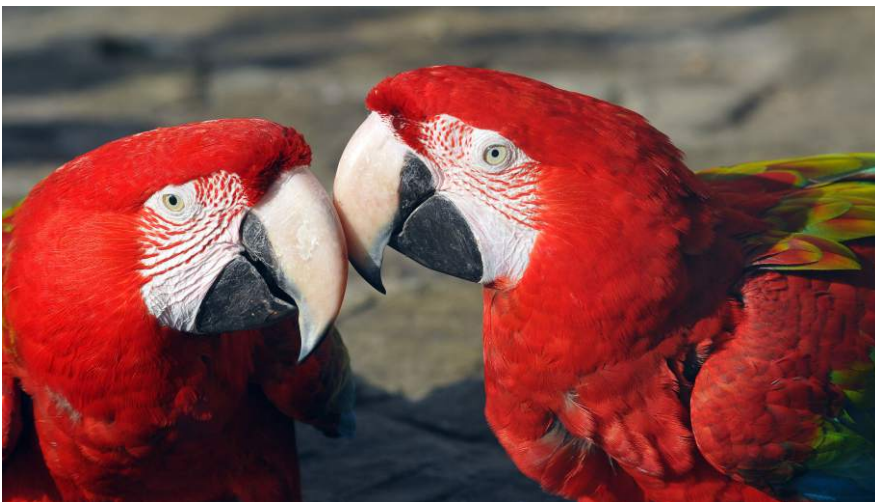
Az arapapagájok monogám párkapcsolata akár egész életen át is tarthat.

Az állatok egy része tartós párkapcsolatban él, amely akár élethosszig is tarthat. Különösen gyakori ez a madaraknál, ami azért nem meglepő, mert a tojások kiköltése és a fészeken ülő, eleinte magatehetetlen fiókák etetése, felnevelése lényegesen hatékonyabb, ha megosztják egymás közt a munkát. Számos madár esetében a pár évről évre látványos szertartással: násztánccal, hajlongással erősíti meg a kapcsolatát; ez jellemző például a darvakra. Nem ritkán a pár előző évi utódai is besegítenek a következő évi fiatalok felnevelésébe, könnyítve a szülők dolgát, növelve a következő generáció életben maradási esélyeit, és egyben gyakorlatot szerezve az ivadékgondozásban. A tartós párkapcsolat a madarakon túl az emlősök egy részére, valamint egyéb állatfajokra is jellemző. A farkasfalkákat is többnyire a szülőkkel maradó, még nem önállósult utódok alkotják. Nem kevés rágcsáló is ismert, amely hosszú távra választ párt.