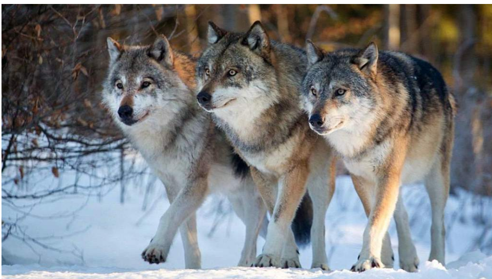
A farkasfalka általában a szaporodó párból és annak kifejlett, de még nem önállósult kölykeiből áll össze.