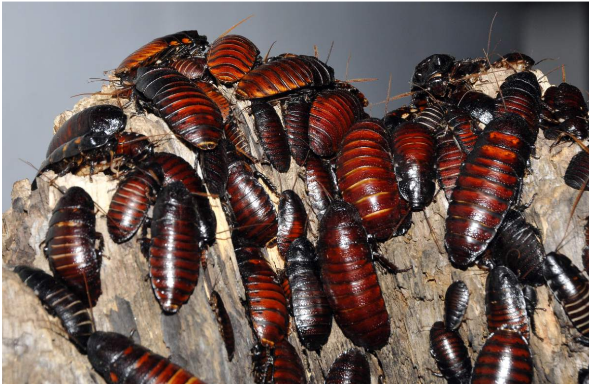
A bütykös csótány növendékei a felnőtt példányok ürülékéből szerzik be az emésztésüket segítő mikrobákat.

A bütykös csótányok nőstényei álelevenszüléssel hozzák világra utódaikat, amelyek még pár napig az anyjuk széles teste alatt keresnek menedéket. A csótányok elsősorban élettelen, korhadó növényi anyagokkal táplálkoznak, melyek emésztéséhez szükségük van a bélrendszerükben élő mikrobákra. A fiatal állatok az anyai gondoskodás ideje alatt jutnak ezekhez a mikrobákhoz, melyeket az anyjuk ürülékéből vesznek magukhoz. A bütykös csótányok egyszerű szerkezetű kolóniában élnek, amelynek élén egy domináns hím foglal helyet. Ez a hím megütközik a címéért és a nőstényekért a többi hímekkel, és őrzi a hozzátartozó kolóniát. Ha idegen betolakodó, vagy ellenség közelít, hangos sziszegéssel próbálja meghátrálásra bírni, egyben figyelmezteti is a többieket a veszélyre.