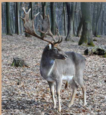
A szarvasok agancsa nem gyilkolásra, hanem sportszerű párbajozásra való.

Nem mindig van szükség fizikai összecsapásra ahhoz, hogy a rangsor eldőljön: a fegyverzet mutogatása és a fenyegető testtartás, a magabiztos fellépés sokszor önmagában is elegendő.