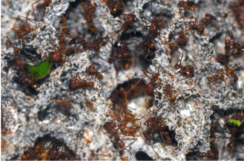
A levélvágó hangyák euszcíális társadalmában minden egyednek megvan a maga feladata.

Attól, hogy bizonyos állatok olykor nagy tömegben gyűlnek össze meghatározott helyeken, még nem biztos, hogy egymás társaságát keresik. Bizonyos csigák olykor nagy csoportokban jelennek meg, de semmi nem utal arra, hogy e csoportok tagjai közt valódi kapcsolat lenne. A csigák nem alkotnak családokat, gyülekezésük általában valamilyen kedvező környezeti feltételek (pl. bőséges táplálékforrás, kedvező telelőhely) kihasználására irányul. Hasonlóképpen egyes férgek, rovarlárvák is nagy tömegben találhatóak meg, anélkül hogy valóságos