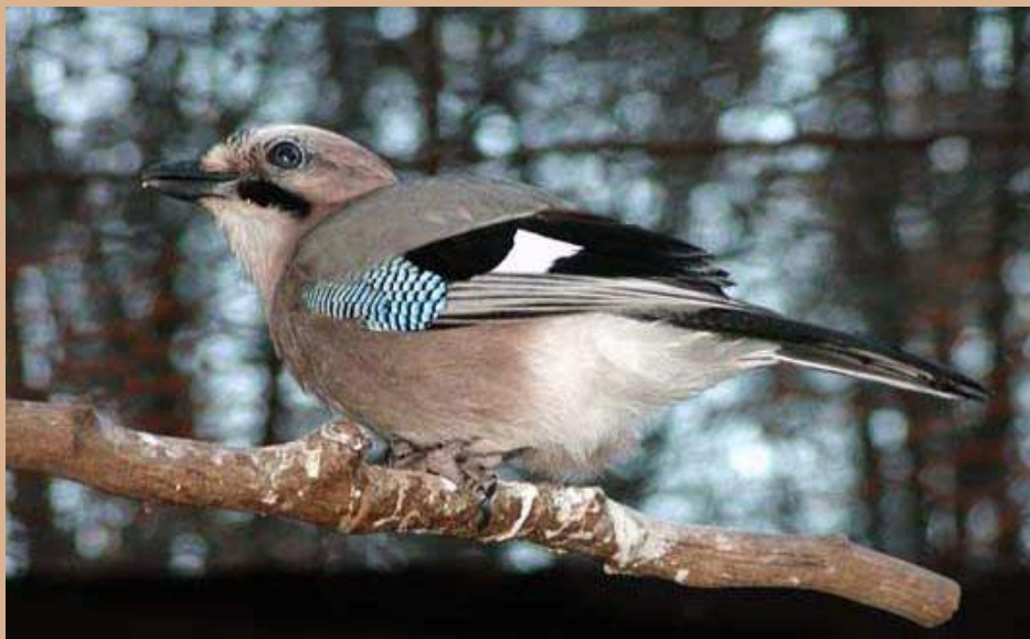
A szajkó remek hangutánzó: egész életében képes újabb hangokat megtanulni.