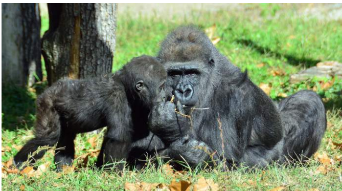
A gorillák arcmimikája nem túl gazdag: csapatukban a rangsorviszonyok stabilak, ezért nem kell folyton érzelmeiket kifejezniük.