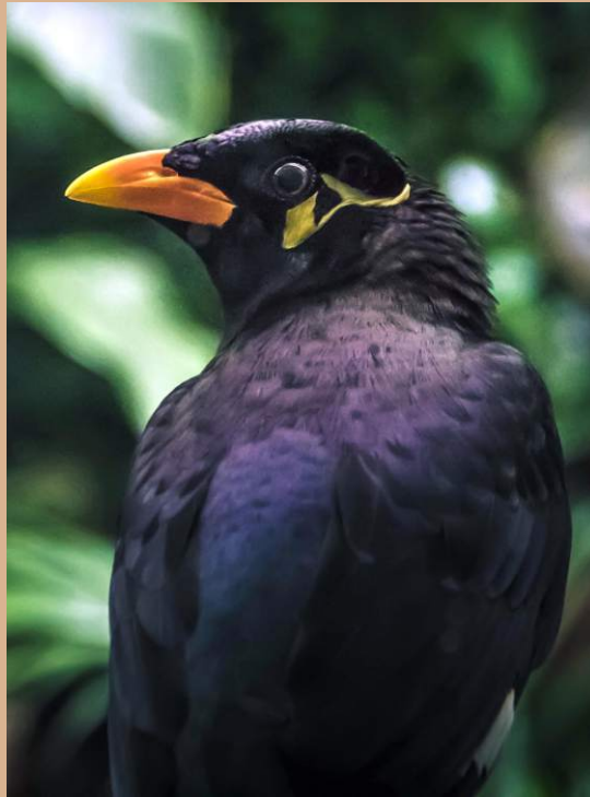
A beo a világ egyik legjobb hangutánzója: nemcsak más madarak hangját, hanem mesterséges zajokat is élethűen utánoz.

Az énekesmadarak az éneket is egymástól tanulják. A fajta jellemző alapséma ugyan velük születik, de a finomabb trillákat, strófákat a hím fiókák a közelben éneklő apjuktól lesik el. Ha a fiókát idegen madárfaj egyedei közt nevelik fel, akkor azoknak az énekét tanulja meg. Egyes madarak, mint például a seregélyek, egész életükben képesek újabb és újabb hangokat megtanulni és utánozni.